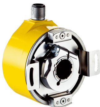
Изображения могут отличаться от оригинала