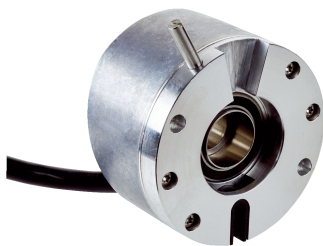
Изображения могут отличаться от оригинала