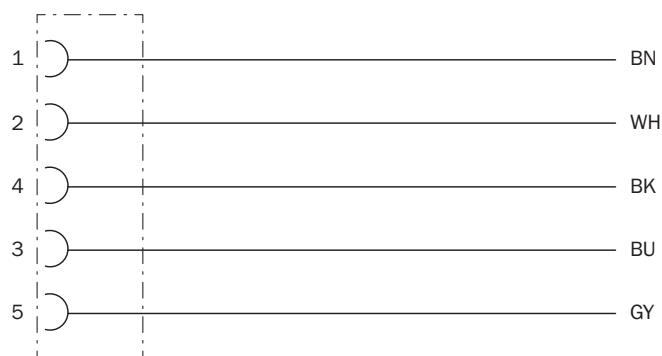
Contact assignment of the M12 female connector