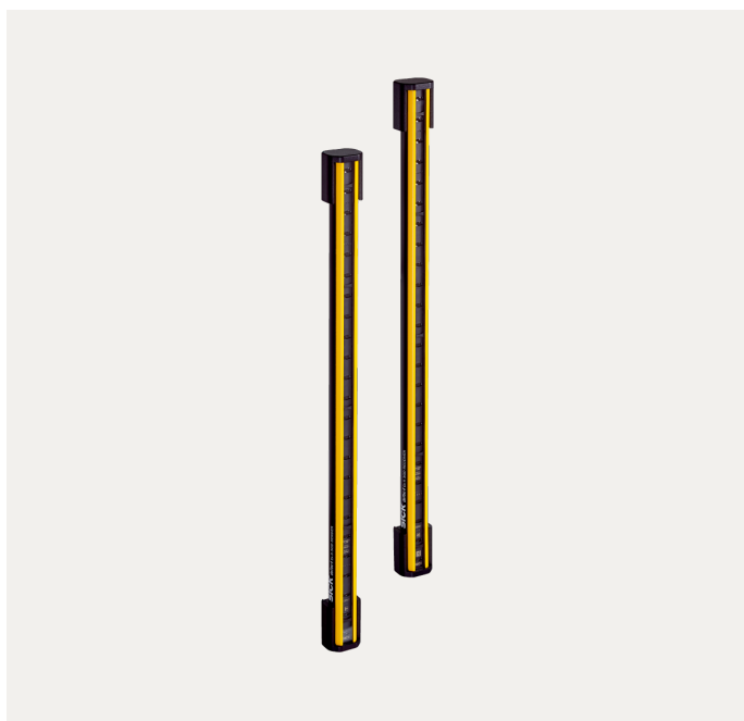
Изображения могут отличаться от оригинала

Прочие варианты исполнения устройства и принадлежности можно найти по ссылке: www.sick.com/deTec