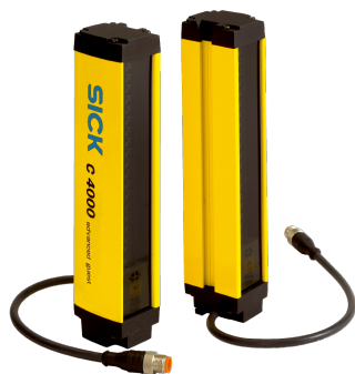
Изображения могут отличаться от оригинала