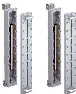
Изображения могут отличаться от оригинала