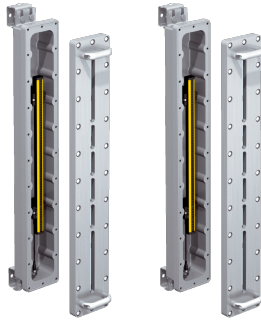
Изображения могут отличаться от оригинала