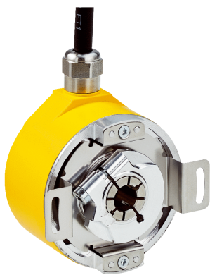
Изображения могут отличаться от оригинала