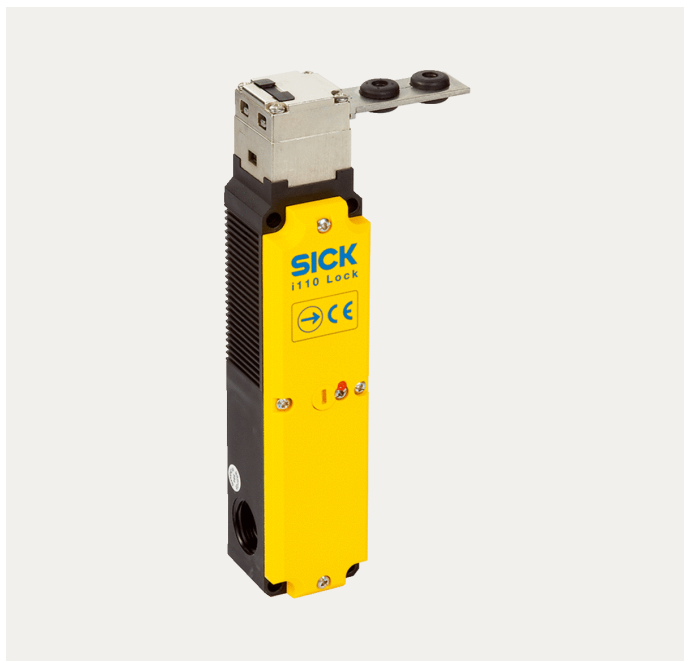
Actuator niet bij levering inbegrepen

Verdere apparaatvarianten en accessoires op www.sick.com/i110_Lock