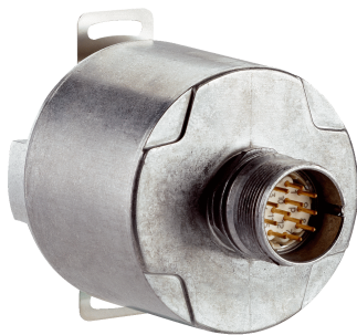
Afbeelding kan afwijken