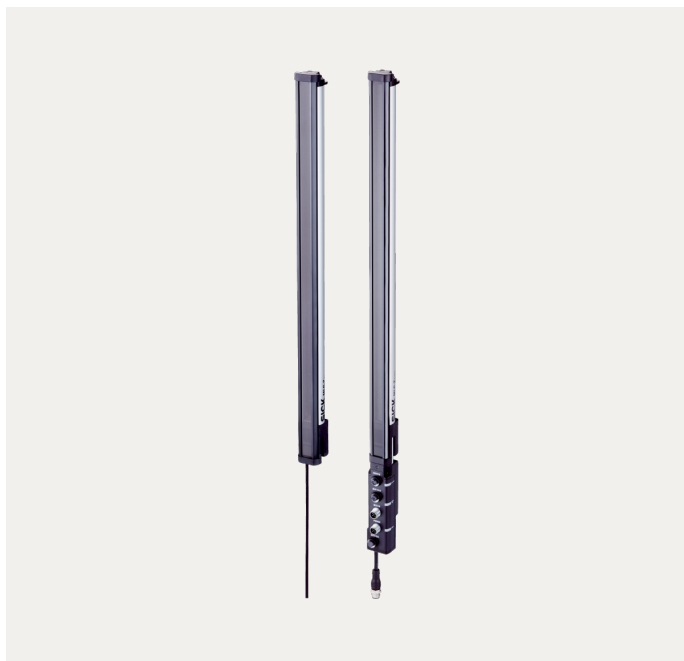
Abbeelding kan afwijken

Verdere apparaatvarianten en accessoires op www.sick.com/MLG-2