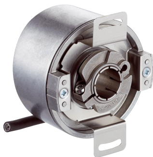
Afbeelding kan afwijken