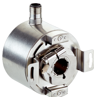
Afbeelding kan afwijken