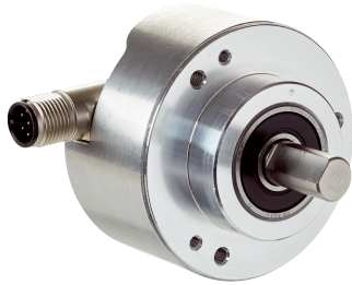
Afbeelding kan afwijken