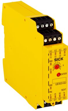
Afbeelding kan afwijken