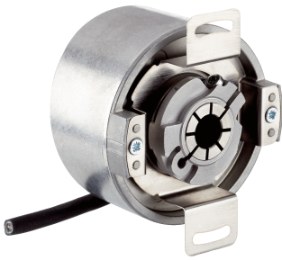
Afbeelding kan afwijken