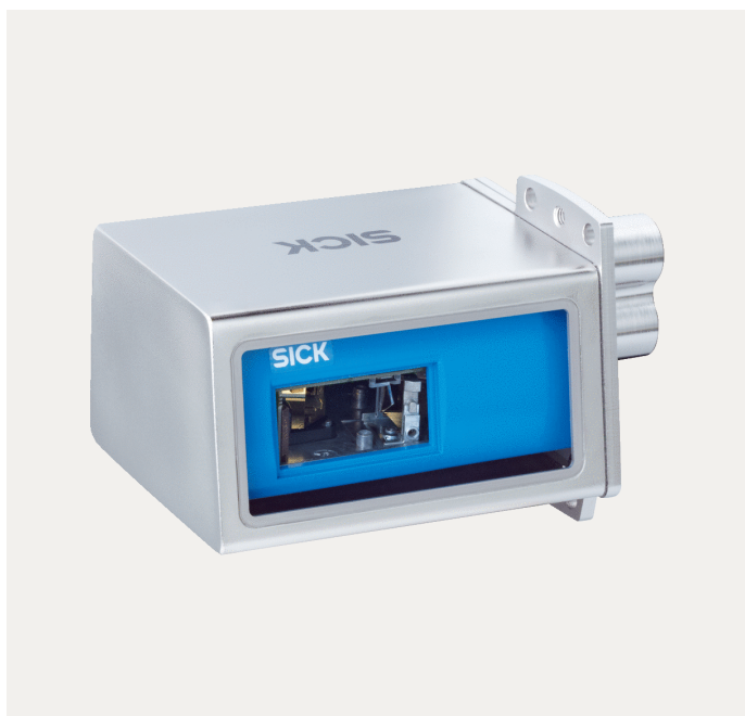
Atbeelding kan afwijken

Verdere apparaatvarianten en accessoires op www.sick.com/CLV62x