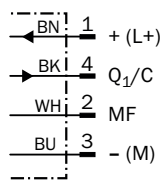
Schéma de raccordement Cd-273