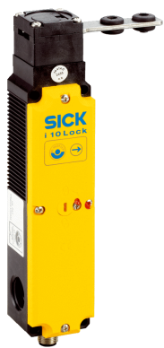
actionneur non compris dans la livraison