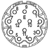
Ansicht Gerätestecker M23 am Gehäuse.