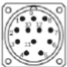
View of the connector M23