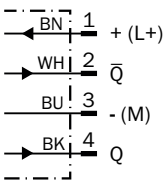
Schéma de raccordement Cd-083