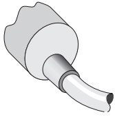
Schéma de raccordement Cd-001